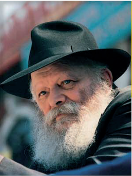
מעובד על-פי דברי הרבי מליובאוויטש